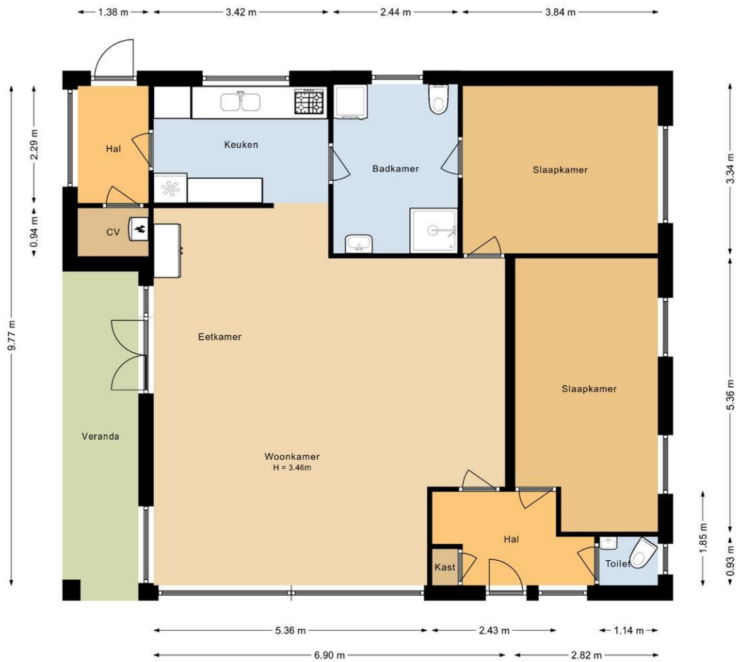
Begane grond Paradijsweg 104 Ter Aar